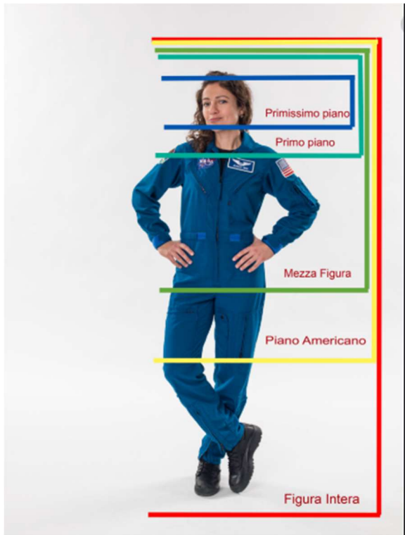
Figura intera dove sia importante mostrare l'intero corpo. (Es. fitness).

Fonte immagine Pinterest: https://www.pinterest.it/pin/333407178659454529/ emilipasquale.eu